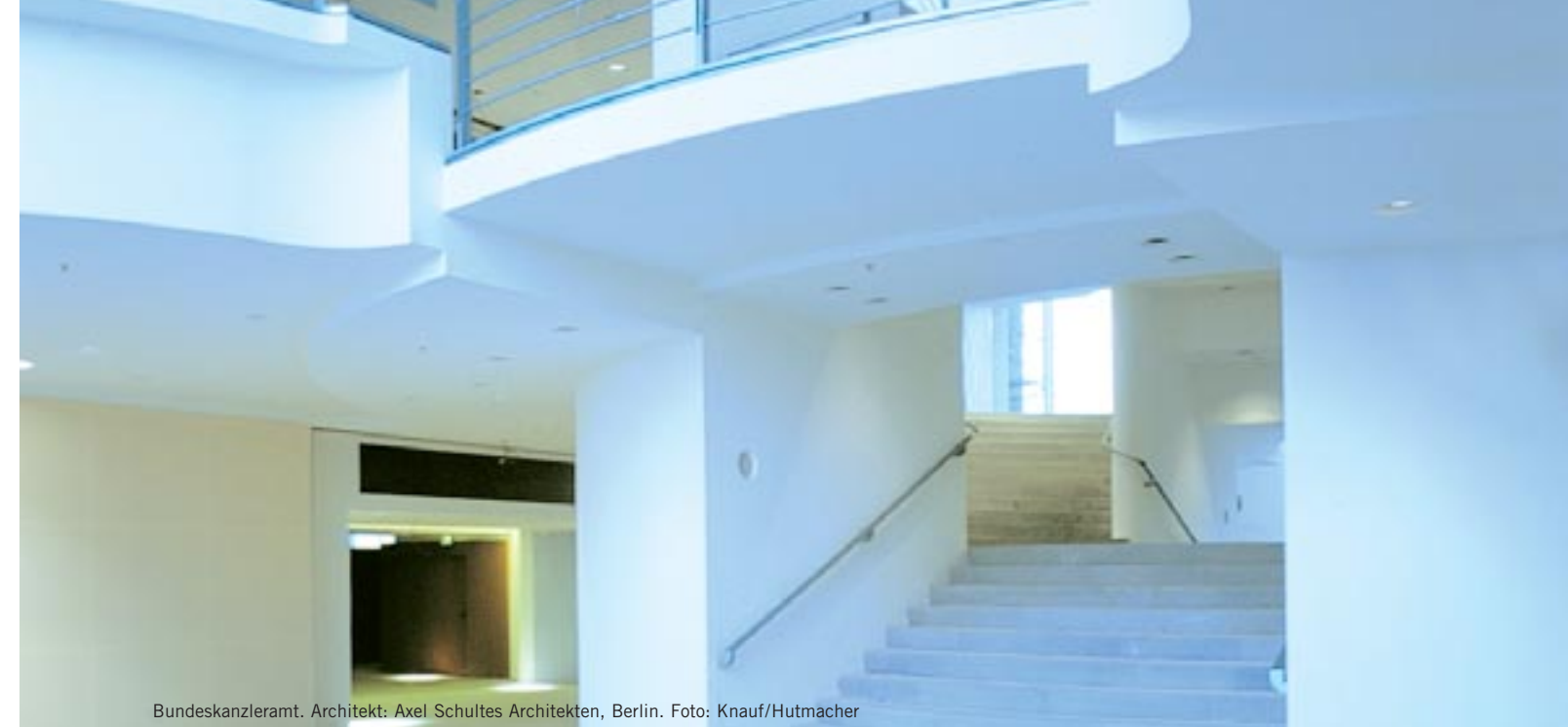
Bundeskanzleramt. Architekt: Axel Schultes Architekten, Berlin.

Bearbeitungsspuren, wie z. B. Traufelstriche, werden weitgehend vermieden. Auch bei der Qualitätsstufe 3 sind bei Streiflicht sichtbar werdende Abzeichnungen nicht ganz auszuschließen. Grad und Umfang solcher Abzeichnungen sind gegenüber dem Standard Q2 – geglättet geringer.