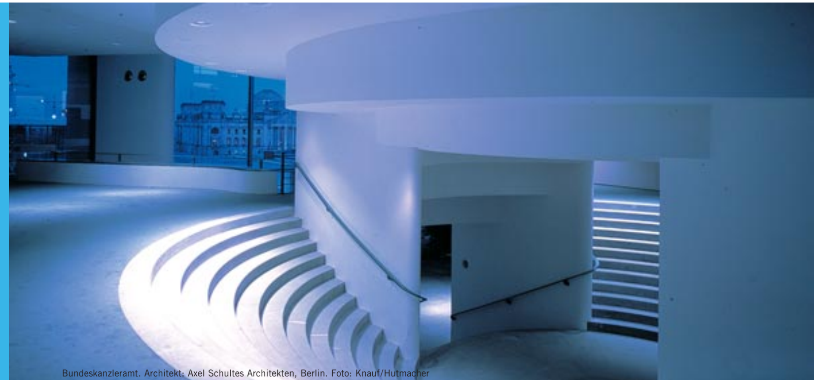
Bundeskanzleramt. Architekt: Axel Schultes Architekten, Berlin.